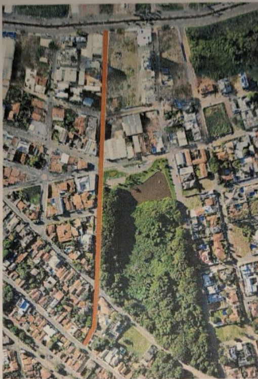
Figura I – Ilustração Georreferenciada da Rua 1, bairros Rosário e São Francisco.

EARTH 2026 (Extensão KMZ; KML)(Lat. Inicial: 18°10'5.16"S; Long. Inicial: 47°56'14.20"O) (Lat. Final: 18°10'23.70"S; Long Final: 47°56'15.96"O)