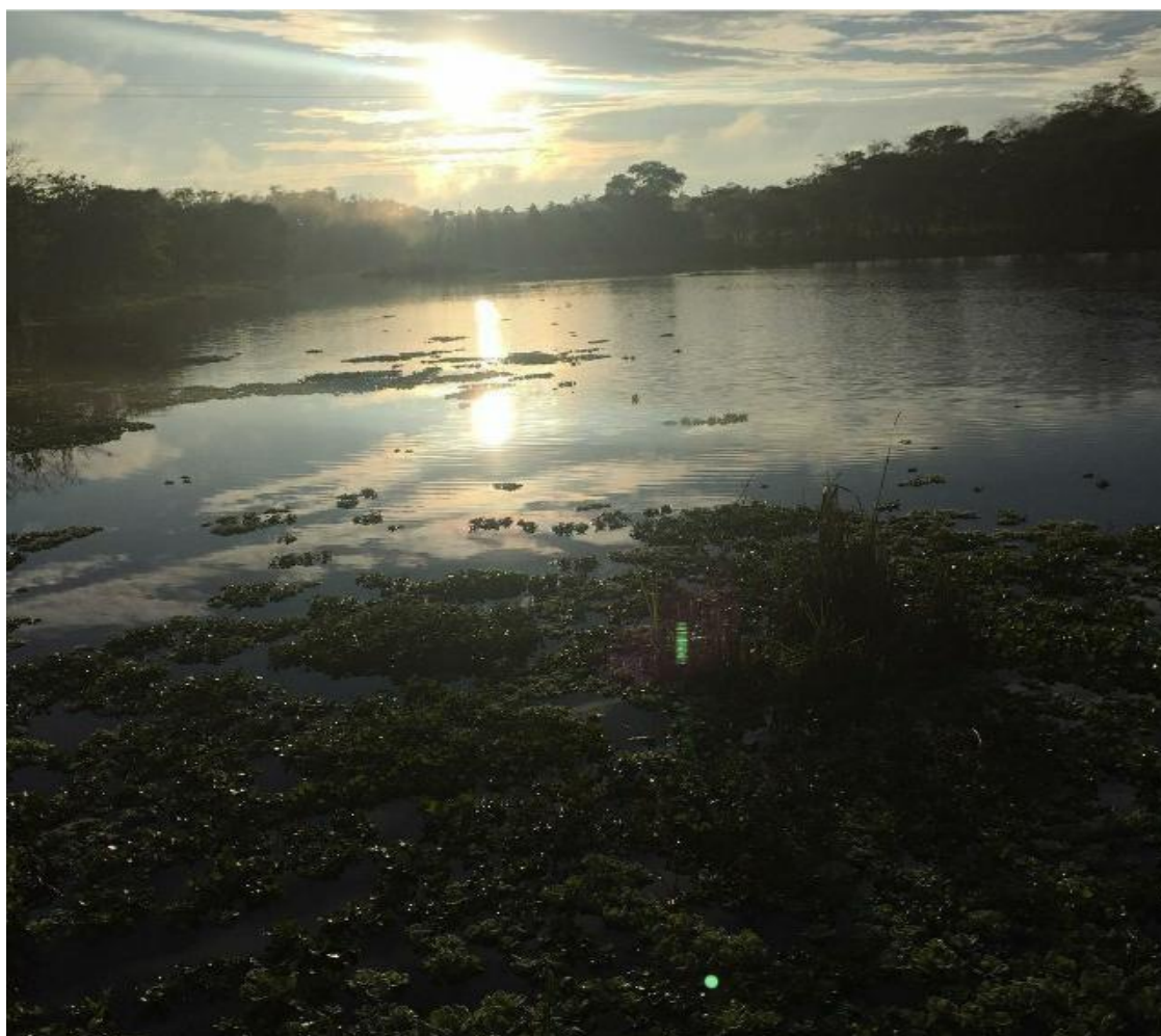
Imagem da Represa.